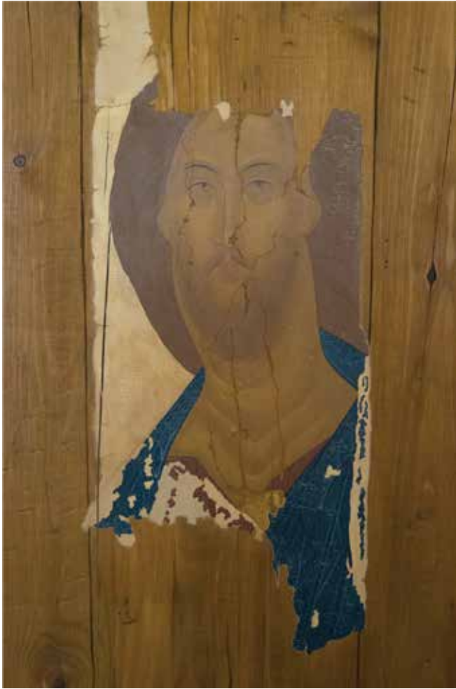
ікона “Звенигородський Спаситель”

Щоб допомогти нам глибше розважати про Ісуса, присутнього у тому, що спотворено, цього Адвенту я хотів би запропонувати роздуми над іконою Звенигородського Спасителя на основі роздумів отця Генрі Ньюена. Андрій Рубльов написав ікону, яку також називають «Миротворець», в Росії в 15 столітті. Ікона була загублена, але її знайшли в 1918 році в сараї біля собору Успіння Пресвятої Богородиці в місті Звенигород, Росія. Її первісна чарівність та детальна досконалість авторської роботи були втрачені; насправді, її знайшли у дуже пошкодженому стані, зіпсовану і загублену.